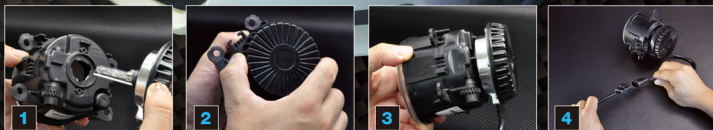
1 ライトユニットにHIDを差し込み。 2 時計回りに回してロック。 3 これで本体の取付けはOK。 4 あとは車両側のコネクターに接続で完了。