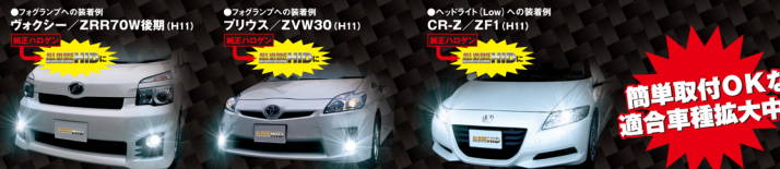
●フォグランプへの装着例 フォグシー / ZRR70W後期 (H11) ●フォグランプへの装着例 プリウス / ZVW30 (H11) ●ヘッドライト(Low)への装着例 CR-Z / ZF1 (H11)