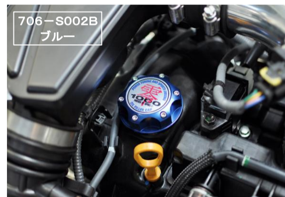
レッドアルマイトとブルーアルマイトの2カラーをラインナップ