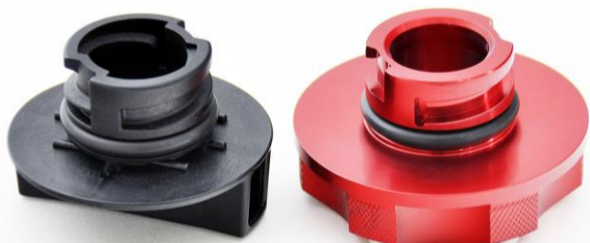
純正 オイルフィルターキャップ