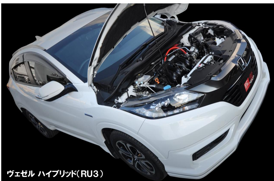
ヴェゼル ハイブリッド(RU3)