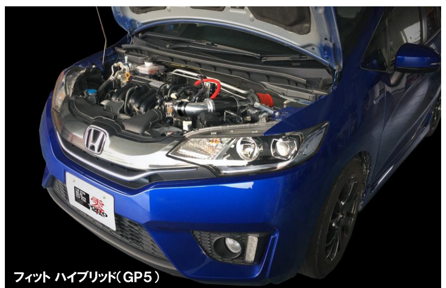
フィット ハイブリッド(GP5)